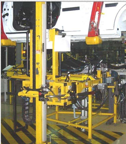
Sistema móvel semi-automático, com material a montar e equipamento de aperto integrado

Implementação no cliente, formação dos utilizadores e assistência técnica.