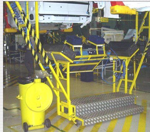
Sistema móvel automático, com suporte de equipamento, materiais e operador