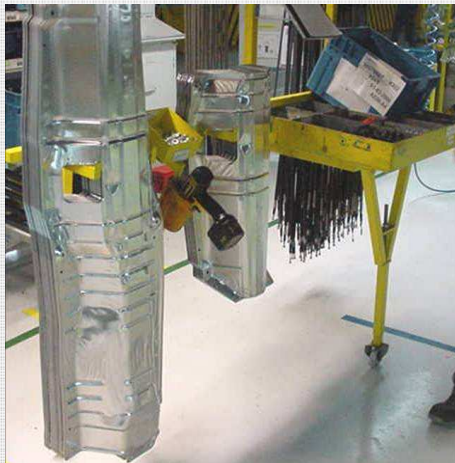
Sistema móvel, com suporte de equipamento e materiais de grandes dimensões