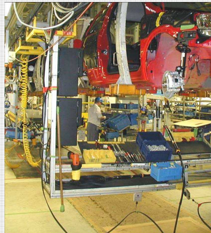
Sistema móvel semi-automático, com suporte de equipamento, materiais