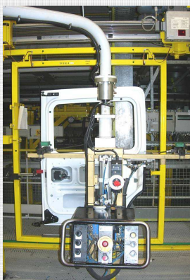
Manipulador de Movimentação de grandes Volumes

Desenvolvimento e construção, com designs inovadores, de equipamentos de manipulação e mesas de montagem com ou sem pontos de referência. Implementação no cliente, formação dos utilizadores e assistência técnica.