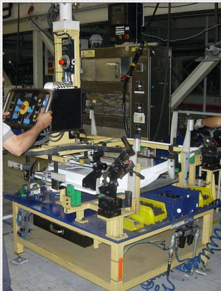
Mesa de Montagem

Em processo de montagem de diferentes componentes