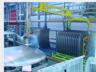
Postos de Trabalho