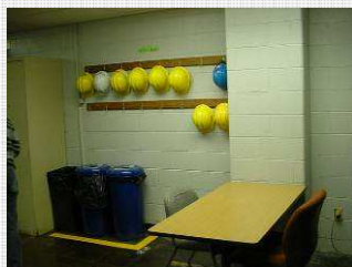
Áreas de descanso